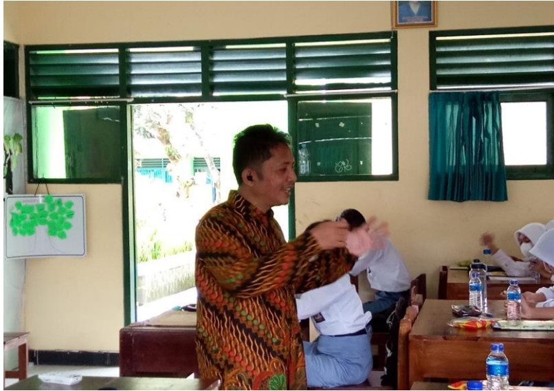
Gambar 2: Proses Question and Answer Tim Pengabdi dengan peserta