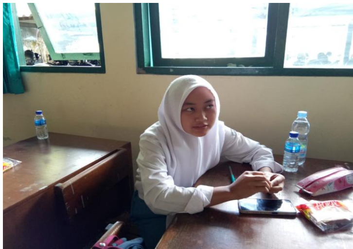
Gambar 3: Peserta antusias mengikuti proses Question and Answer.

Para siswa penerima materi termotivasi dalam pemanfaatan teknologi informasi. Hal ini ditunjukkan dengan kemampuan mereka menggunakan aplikasi–aplikasi yang ada dalam internet. Mereka tertarik untuk menggunakan internet sebagai ajang aktualisasi diri dalam bentuk tulisan/gambar/karikatur/video dalam internet.