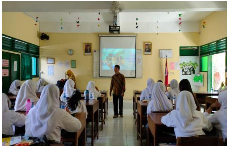
Gambar 1: Tim Pengabdian mempresentasikan materi Etika Jurnalisme Online

dan bernegara. Banyak pemberitaan di media masa memojokkan siswa karena tawuran yang dipicu konflik di media sosial.