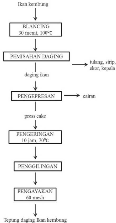
Gambar 1. Diagram Alir Pembuatan Tepung Daging Ikan Kembung

Pembuatan dange dengan campuran tepung daging ikan dilakukan mengingat Indonesia bagian timur merupakan daerah penghasil ikan. Jenis ikan yang mudah diperoleh dalam jumlah banyak, mempunyai rasa dan aroma khas serta harganya relatif murah adalah ikan kembung ( Rastrellinger kanagurta ). Selain itu, ikan tersebut memiliki tulang sedikit dan mudah hancur jika ditepungkan. Untuk mendapatkan dange dengan campuran tepung daging ikan yang berkualitas, perlu dicari formulasi dan proses pengolahan yang tepat. Oleh karena itu, perlu diteliti variasi konsentrasi tepung daging ikan yang dapat disubstitusikan serta variasi lama waktu pemanggangannya karena faktor tersebut