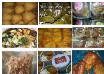
Gambar 1. Produk hasil produksi anggota UP2K

Kegiatan pengabdian ini dilaksanakan secara offline (tatap muka) pada tanggal 5 Maret 2022 di Balai Pertemuan Kelurahan Gedongkiwo dengan tetap menjaga protokol kesehatan. Kegiatan dihadiri oleh 25 peserta yaitu para pelaku usaha anggota UP2K Kelurahan Gedongkiwo yang semuanya berjenis kelamin perempuan. Pelaku usaha ini semuanya bergerak dibidang kuliner. Produk yang dihasilkan terdiri dari berbagai jenis keripik, peyek kacang, ayam goreng/bakar, kupat tahu, lotek dan gado-gado, bakmi goreng, ricebowl , mie ayam dan bakso, burger, empek-empek, siomay, egg roll berbagai snack ( risoles , tahu bakso, carang gesing, nogosari, pastel, lumpia, lempur, arem-arem dan kuputarung).