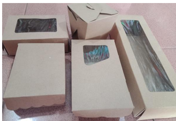
Gambar 3. Kemasan berbagai bentuk

Tahap kedua (Persiapan Kegiatan), dalam tahapan ini melakukan persiapan tempat, materi pelatihan serta mempersiapkan alat praktek berupa kemasan dengan berbagai bentuk (gambar 3) dan sampel produk untuk dikemas. Materi disiapkan oleh tim pengabdian dalam bentuk power point agar lebih mudah dipahami oleh peserta, hal ini akan membantu pencapaian target luaran yaitu peserta paham/memiliki wawasan yang luas tentang pengemasan produk. Persiapan alat peraga berupa kemasan dengan berbagai bentuk disediakan oleh tim pengabdian untuk memudahkan dalam praktik mengemas. Sedangkan persiapan tempat, peralatan berupa Lcd proyektor , whiteboard , spidol , roll kabel serta sampel produk yang digunakan dalam praktik mengemas berdasarkan hasil koordinasi dengan pengelola UP2K disediakan oleh UP2K. Hal ini menunjukkan adanya peran serta/kontribusi dari peserta untuk kelancaran kegiatan pelatihan.