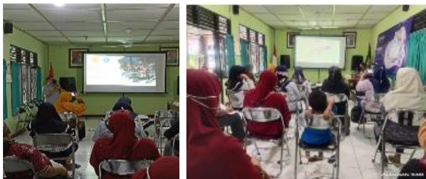
Gambar 4. Penyampaian Materi Pelatihan

disampaikan. Penyampaian materi ini berlangsung selama 3 jam dan diakhiri dengan pertanyaan dari tim pengabdian kepada peserta untuk melihat tingkat kedalaman pemahaman materi yang sudah disampaikan. Kegiatan selanjutnya yaitu praktik mengemas produk. Praktik mengemas menggunakan alat peraga berupa kemasan berbahan kertas dan plastik dengan berbagai bentuk dan ukuran. Sampel produk yang dikemas yaitu produk kuliner hasil produksi peserta. Dalam praktik ini jenis bahan kemasan yang dipilih disesuaikan dengan jenis produk sehingga unsur keamanan saat pendistribusian produk tetap terjamin dan tampilan produk lebih menarik.