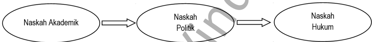
Gambar 2. Tahapan Perkembangan Naskah Rancangan Peraturan Daerah

Bupati". Peraturan ini kemudian diganti dengan Peraturan Dewan Perwakilan Rakyat Daerah Nomor 01 Tahun 2014 tentang Tata Tertib Dewan Perwakilan Rakyat, yang mana pengaturan tentang pembahasan Perda terdapat dalam Pasal 90 ayat (1) bahwa "Rancangan peraturan yang berasal dari DPRD atau Bupati dibahas oleh DPRD dan Bupati untuk mendapatkan persetujuan bersama".