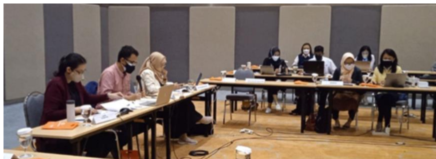
Gambar 1. Proses Kurasi

Setelah itu, mahasiswa mempelajari cara mengolah dan mengedit foto secara digital menggunakan software editing. Salah satu software profesional editing yang digunakan adalah Adobe Photoshop.